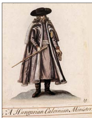
Magyar református lelkész - vízfestmény Régi erdélyi viseletek. Viseletkódex a 17. századból. Európa Kiadó, Budapest, 1990, 19. kép.